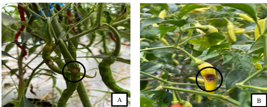
Gambar 2. Gejala khas penyakit antraknosa pada A. cabai merah dan B. cabai rawit

Pengamatan di lapangan menunjukkan adanya beberapa tanaman yang memperlihatkan gejala khas penyakit antraknosa, seperti bercak nekrotik berbentuk melingkar, lesi berwarna gelap, dan hingga busuk pada buah (Gambar 2). Hal ini sesuai dengan hasil penelitian (Bandgar et al., 2018)(Ibrahim & Hidayat, 2017)(Zakaria, 2021)(Rattanakreetakul et al., 2023)(Luis et al., 2025) gejala antraknosa pada buah memiliki bercak nekrotik bulat, cekung dan gelap kehitaman.