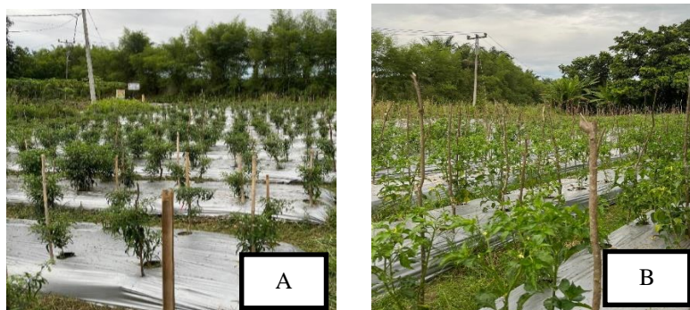
Gambar 1. Kondisi lahan pengamatan pertanaman A) cabai merah dan B) cabai rawit

Hasil pengamatan di lapangan varietas Indrapura memiliki karakter buah memanjang, serta warna merah pekat pada fase fisiologis matang sedangkan varietas Sigma pada cabai rawit memiliki karakter buah kecil dan seragam, serta menunjukkan toleransi relatif terhadap tekanan biotik di lapangan.